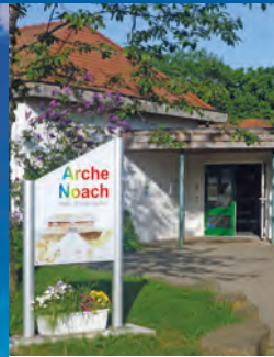
Kindergarten Arche Noach