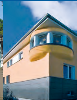
Schule am Sellenberg