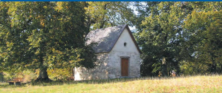
Sellenberg mit Kapelle

Die knapp 3.000 Einwohner zählende Gemeinde liegt im wirtschaftlich gesunden und touristisch aufstrebenden Alb-Donau-Kreis. Die Lage am Albtrauf, der von der UNESCO zum NATIONALEN GEOPARK ausgezeichneten Schwäbischen Alb, garantiert nicht nur den Wanderern beeindruckende Fernblicke und geologische Einmaligkeiten. Westerheim und sein Umfeld bieten Besuchern und Einwohnern einen bunten Strauß an Möglichkeiten, die es nur zu entdecken gilt.