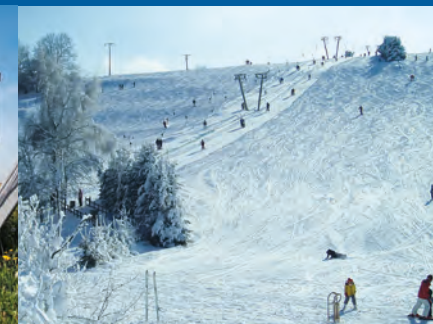
Blick auf den Skilift Halde