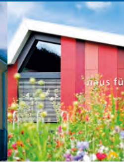
Haus für Kinder

Die Zukunft einer jeden Gesellschaft liegt in den Händen unserer Kinder. Ihnen ein lebenswertes Umfeld zu bieten, ist eine unserer vordringlichsten Aufgaben. In Westerheim sind Kinder im Zentrum nicht nur gerne gesehen – sie sind das Zentrum. Kinder brauchen für ihre Entwicklung Entfaltungsmöglichkeiten und eine gezielte Förderung ihres Talents. In Westerheim bekommen sie beides. Mit unseren Einrichtungen können wir für die Kleinsten unserer Gesellschaft - von Anfang an - Orte der Gemeinschaft, der Betreuung und Bildung anbieten und somit auch zu einer guten Vereinbarkeit von Familie und Beruf beitragen.