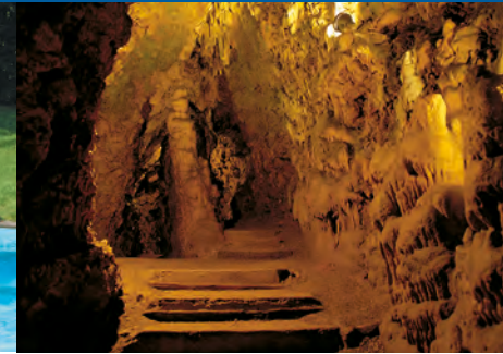
Die Schertelshöhle mit Blick auf den „Schiefen Turm“ und die „Steinerne Orgel“

Egal ob zu Fuß, hoch zu Ross oder mit dem Fahrrad - es gibt viel zu entdecken rund um Westerheim: Über ausgedehnte Felder vorbei an Wacholderheiden und auf Höhen, die in Europa die Wasserscheide darstellen. Sie können Höhlen besichtigen, Tennis oder Minigolf spielen, im Alb-Bad Spa haben und in der Sauna entspannen. Oder Sie folgen dem Kappellenwanderweg, von einer Kapelle zur nächsten. Schön ist es auch die unzähligen Rad- und Wanderwege zu erkunden. Zum Beispiel am Albtrauf entlang, mit schönen Ausblicken ins Tal, danach steil hinunter zum Filsursprung.