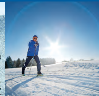
Über 30 km gepflegte Loipen mit Skating werden Ihnen hier geboten.

Eine für die Schwäbische Alb nahezu einzigartige Schneesicherheit lassen immer mehr Ski- und Snowboardfahrer die weiten Anfahrten ins Gebirge vergessen. Vier Schlepplifte sorgen für große Kapazitäten. Auf den vier gut präparierten Langlaufloipen kommen sowohl klassische Läufer als auch Skater auf ihre Kosten. Selbst Snowkiten – man lässt sich einem Gleitschirm in wilder Fahrt über den Schnee ziehen - ist in Westerheim zu Hause. Wer lieber Schneeschuhwanderungen machen will, kann auch das in Westerheim erleben.