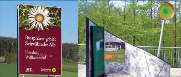
Schertelshöhle Westerheim - Informationszentrum des Biosphärengebiets Schwäbische Alb

Westerheim liegt im rund 85.000 ha großen Biosphärengebiet Schwäbische Alb. Die Schertelshöhle Westerheim ist Teil des Netzwerkes Informationszentren mit dem Themenschwerpunkt Karst und Geologie. Zukunftsweisende Ideen sollen hier modellhaft zeigen, wie der Erhalt der Natur mit einer nachhaltig wirtschaftenden Region einhergehen kann. Durch regionale Zusammenhänge eröffnen sich beispielsweise neue Vermarktungsmöglichkeiten für hochwertige Produkte aus Land- und Forstwirtschaft.