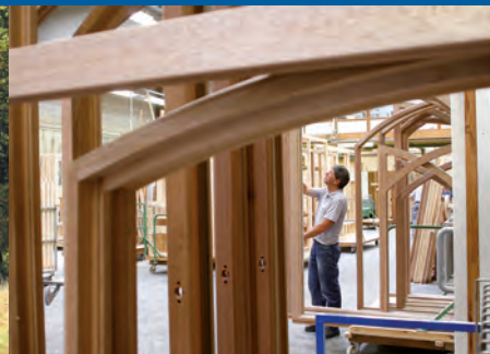
Die Nähe zur Autobahn und die gute Infrastruktur schaffen ein Klima, das leistungsstarke Betriebe geradezu beflügelt.

Die knapp 3.000 Einwohner zählende Gemeinde liegt im wirtschaftlich gesunden und touristisch aufstrebenden Alb-Donau-Kreis. Die Lage am Albtrauf, der von der UNESCO zum NATIONALEN GEOPARK ausgezeichneten Schwäbischen Alb, garantiert nicht nur den Wanderern beeindruckende Fernblicke und geologische Einmaligkeiten. Westerheim und sein Umfeld bieten Besuchern und Einwohnern einen bunten Strauß an Möglichkeiten, die es nur zu entdecken gilt.