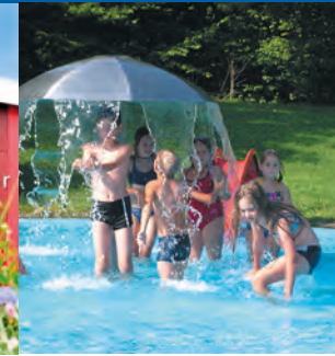
Das Alb-Bad in Westerheim